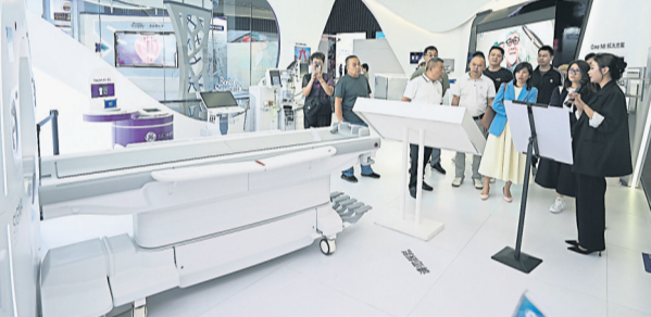
博鳌乐城国际医疗旅游先行区定期展出创新药械，并在园区内先行先试。