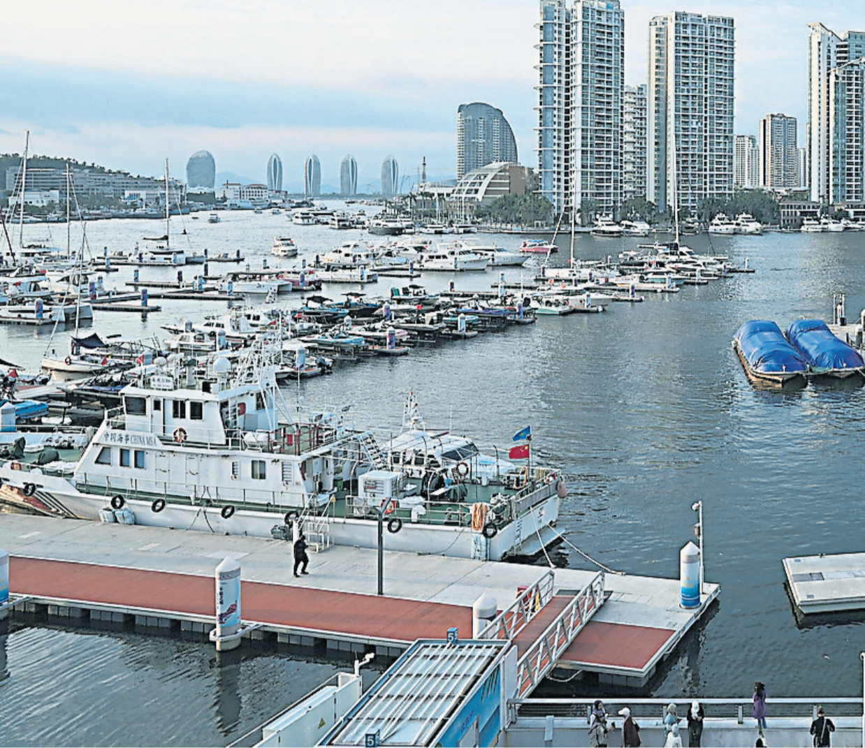
▲未来5年是海南封关运作、政策红利加速释放的启航关键期。