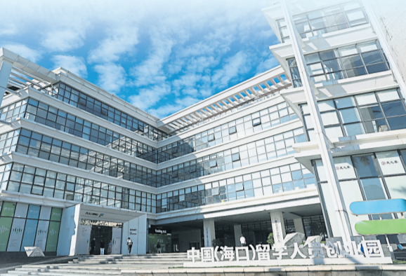
海南与东盟之间的“数据跨境流通”合作已经进入实质化部署，“复兴城正与檳城、赛城等多地园区共建“数字双园”。

双方交流不仅停留在招商层面，而是形成具体的合作模式“海南设计，马来西亚制造”，利用海南在芯片设计、数字产业及人才储备方面的优势，结合马来西亚在半导体封测、制造链条上的成熟生态，实现两地产业的互补发展。